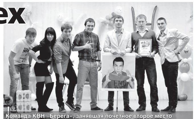
Команда КВН «Берега», занявшая почетное второе место

— Чемпионы прошлого сезона. Они это достойно доказали. Качественная актерская игра, качественный юмор. Всё на высоком уровне. И ведь отнюдь не случайно ребята буквально на следующий день поехали защищать честь нашего университета в Красноярск, на фестиваль лиги КВН «Азия». Давать им дельные советы и стоять вместе с ними на сцене будут лучшие КВНщики, в том числе и участники высшей лиги.