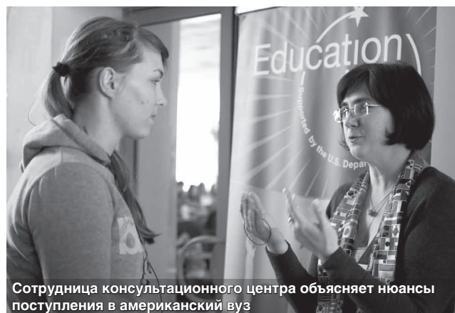
Сотрудница консультационного центра объясняет нюансы поступления в американский вуз

Центр работает бесплатно для своих посетителей, пользование ресурсами центра возможно при наличии читательского билета, для оформления которого принесите две фотографии 3x4 и заполните анкету на месте.