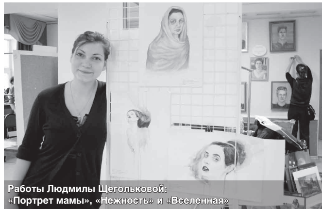
Работы Людмилы Щегольковой: «Портрет мамы», «Нежность» и «Вселенная»

— Один раз я рисовала карандашом-подводкой для глаз. Тогда, на выступлении в «Бродячей собаке», мне очень понравились черты лица одного человека. Он был по-