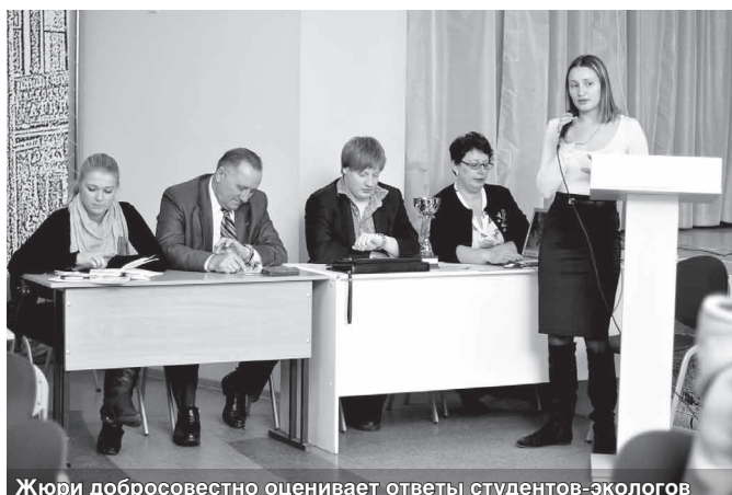
Жюри добросовестно оценивает ответы студентов-экологов