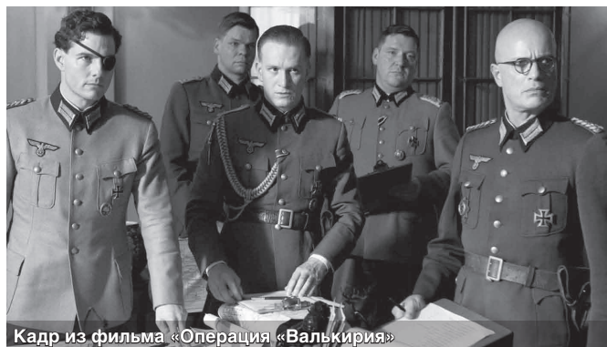
Кадр из фильма «Операция «Валькирия»

Также к минусам работы можно отнести недостаточную насыщенность действием. Из-за этого фильм иногда начинает казаться затянутым. Но, тем не менее, героям искренне сопереживаешь и, несмотря на знание истории, в частности, того, что ни одно покушение на Гитлера не было успешным, хочется до последнего верить: