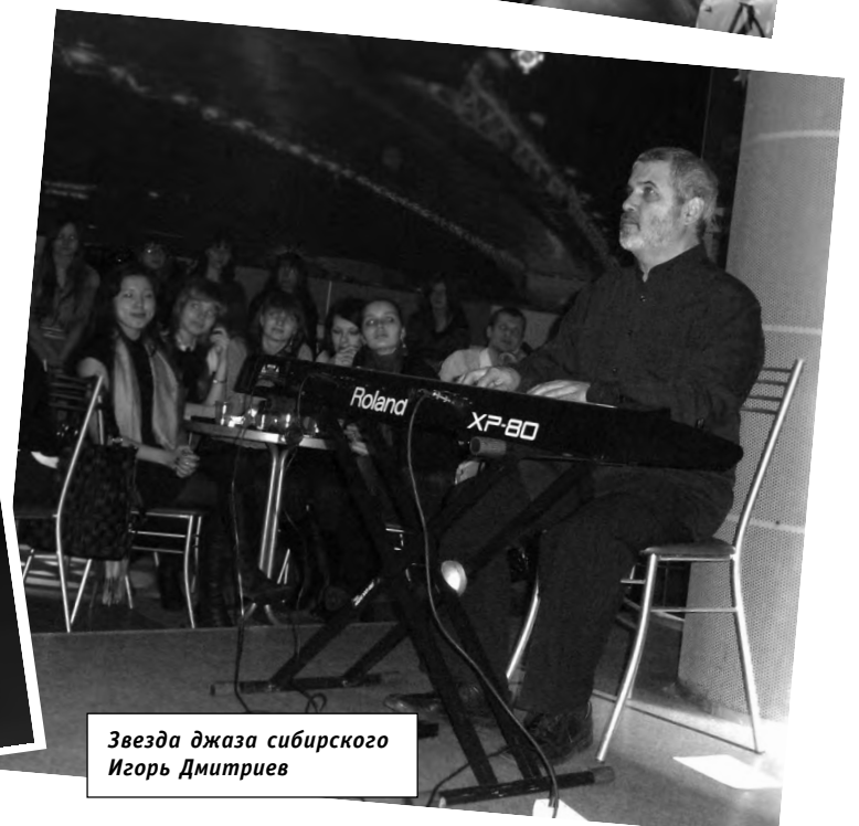
Звезда джаза сибирского Игорь Дмитриев