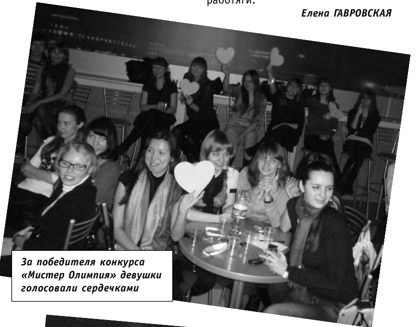
За победителя конкурса «Мистер Олимпия» девушки голосовали сердечками