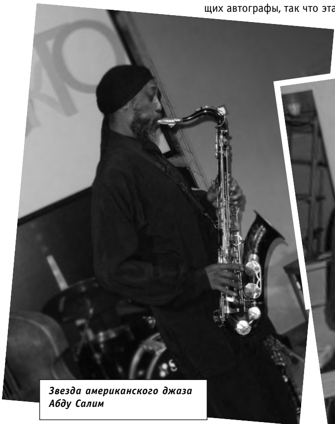
Звезда американского джаза Абду Салим