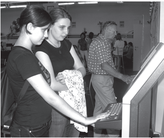
Какую же специальность выбрать?

В этом году совсем по-другому было организовано пространство приемной комиссии. В соответствии с идеей ректора Ю. В. Гусева в спортзале был оборудован современный клиентский зал. Помещение разделили на зоны. Самый большой блок был отдан под рабочие места технических секретарей. Другой блок включал информационную площадку – там разместились стенды приемной комиссии и спе-