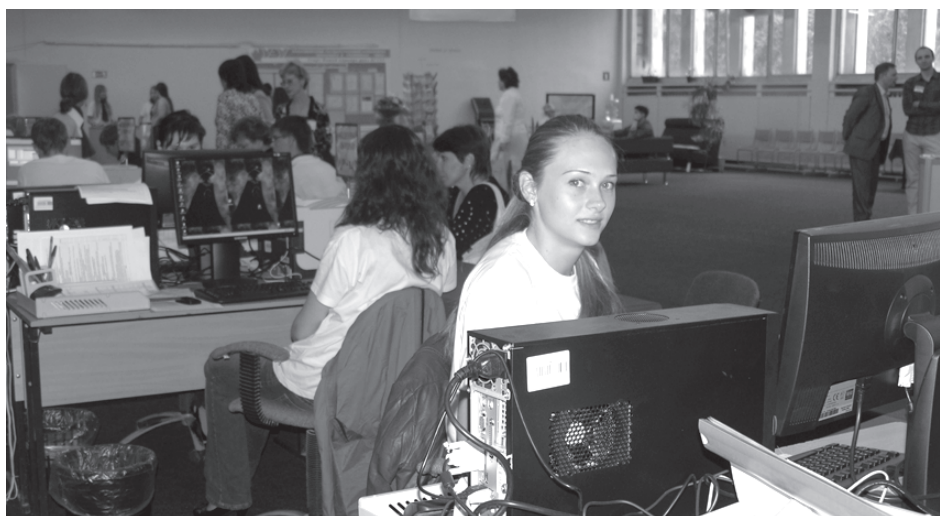
Хорошую организацию работы приемной комиссии отметил едва ли не каждый абитуриент

циальные терминалы. Была выделена консультационная зона, где с абитуриентами работали деканы, представители выпускающих кафедр, юрист. Здесь же находились представители приемной комиссии бизнес-колледжа, так что абитуриенты могли подать документы и в это учебное заведение. Особой популярностью у абитуриентов и их родителей пользовалась подготовленная для них зона отды-