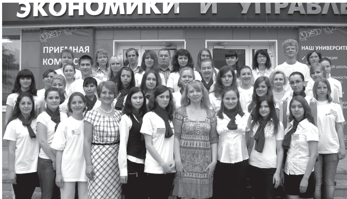
Они обеспечили успешный набор!

В нынешнем году школы Новосибирска и области закончили на три тысячи меньше выпускников, чем в прошлом году. Но, несмотря на такую печальную статистику, НГУЭУ выдержал конкуренцию с другими вузами и успешно провел набор нового пополнения. И хотя окончательные итоги приемной кампании еще не подведены, мы можем привести в газете предварительные результаты.