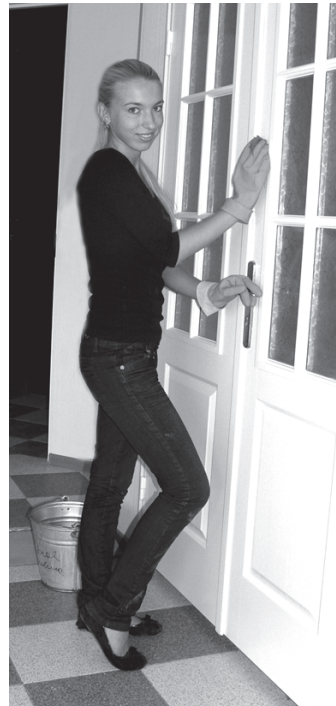
Увертюра к студенческой жизни – наведение чистоты в коридорах

ведром и тряпкой в руках способствовала наведению в них чистоты, даст первокурснице лишний повод уважать себя и быстрее осознать, что университет – ее второй дом.