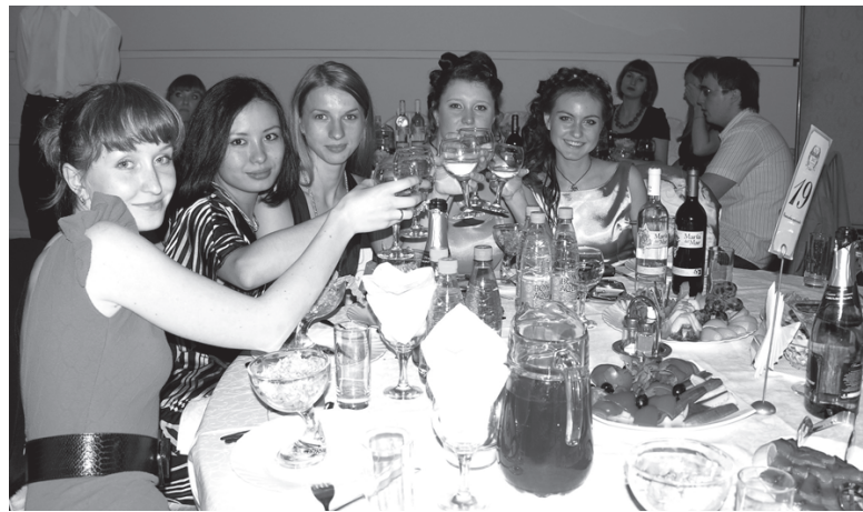
За диплом! За будущую карьеру!

Так пусть публикуемые сегодня фотографии представят выпускникам будущей весны несколько моментов выпускного бала – 2010.