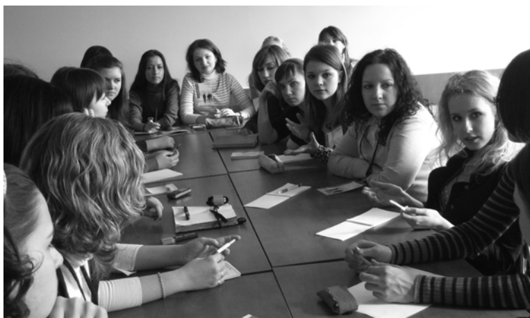
Прошлогодний NovoPRsk: работает круглый стол

Стоит отметить, что особенное уважение многих гостей вызывает тот факт, что NovoPRsk ежегодно создается по инициативе студентов НГУЭУ. «Смотришь и вдохновляешься!», – говорят ребята.