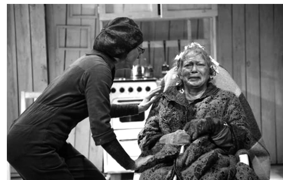
Сцена из спектакля «Королева красоты»

Еще одна премьера «Глобуса» состоится 5 апреля. Спектакль «Королева красоты» поставлен по пьесе ирландца Мартина Мак-Донаха. «Я хочу писать такие пьесы, которые бы немного встряхнули людей», – эти слова принадлежат ее автору. Это произведение – самая первая его пьеса, которую Мак-Донах написал в 1996 году за восемь дней. «Чудо современного театра» – так окрестила ее строгая пресса, а театральная критика наградила одной из самых серьезных премий – премией Лоренса Оливье. За последнее десятилетие пьесы Мак-Донаха завоевали весь мир. И это неудивительно: в его историях комедия и трагедия переплетаются так искусно, что слезы смеха и сострадания сливаются в один бурный эмоциональный поток. Творчество молодого драматурга вызревало на фильмах Мар-