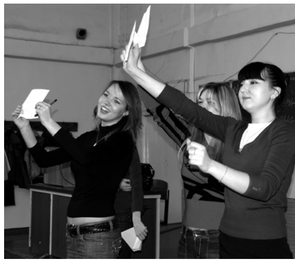
Задание представляют болельщики одной из команд

Понятно, что олимпиада проходила оживленно и весело. Место, которое присуждалось каждой группе, зависело как от качества выполнения письменных заданий членами ее команды, так и от уровня выступлений болельщиков. И, наверно, не так уж важно, какая из групп стала победителем. Важнее другое: студенты получили возможность в живой и непринужденной обстановке продемонстрировать и прочнее усвоить понятия учебной дисциплины.